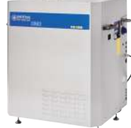
SH SOLAR G