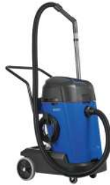
MAXXI II 55 WD