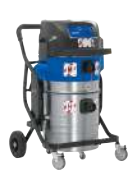
ATTIX 965-0H M SDF XC