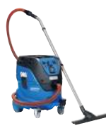
ATTIX 44 H