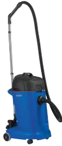
MAXXI II 35 WD