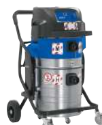
ATTIX 995-0H/M TYPE 22