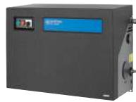
SC UNO 6P