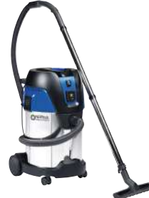
AERO 31 INOX