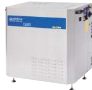
SH SOLAR E