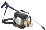
SC UNO 4M PS