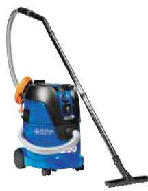
AERO 26 L