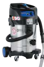
ATTIX 40-0M PC TYPE 22