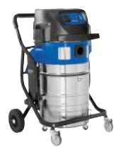
ATTIX 965-21 SD XC