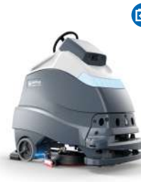
SC50 UVGI Fregadora autónoma UVGI