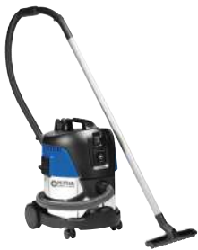
AERO 21 INOX