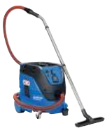
ATTIX 33 M