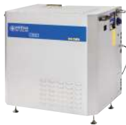
SH SOLAR D