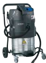
ATTIX 791-2M B1