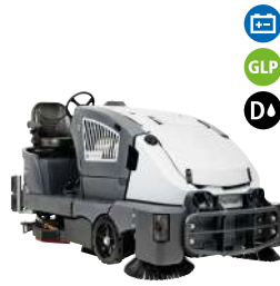
SC7010 Máquinas combinadas