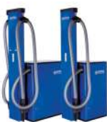
SB STATION TANDEM