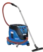
ATTIX 33 H