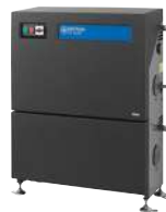
SC DUO 6P