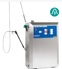
SH AUTO 5M