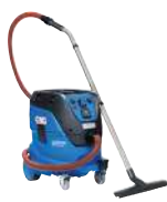
ATTIX 44 M