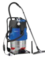
ATTIX 7 SPECIAL PURPOSE