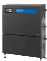
SC DUO 7P