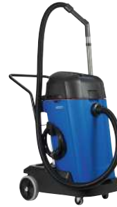
MAXXI II 75 WD