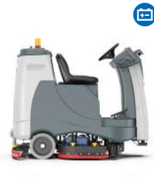
SC60 Fregadora autónoma